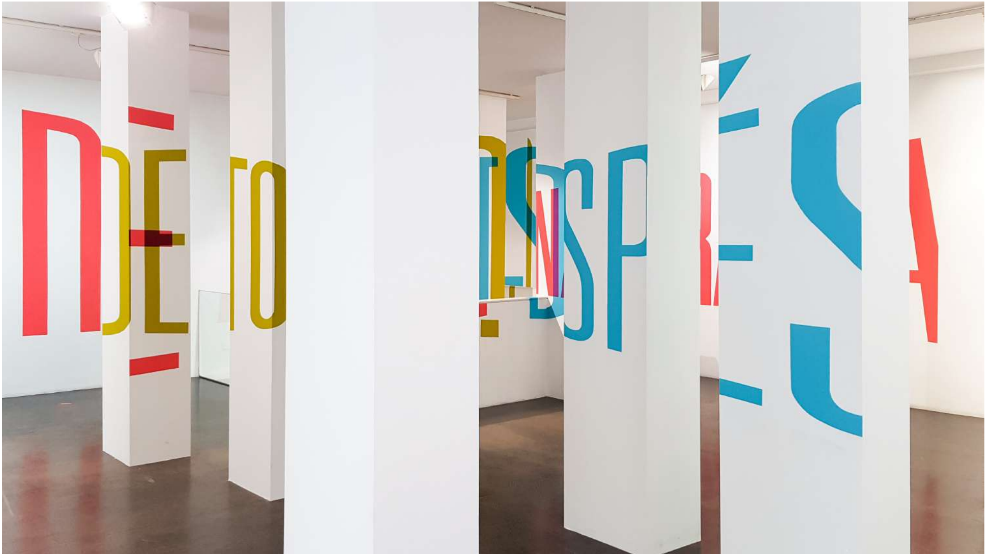
Vista general de la Galería Ponce + Robles. Exposición Vida . Boa Mistura Overview from Gallery Ponce + Robles. Exhibition Vida . Boa Mistura