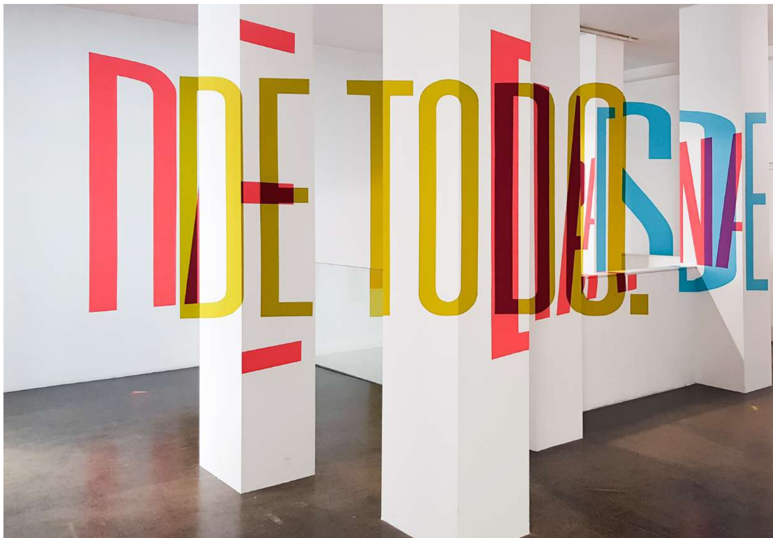
Vista general de la Galería Ponce + Robles. Exposición Vida. Boa Mistura Overview from Gallery Ponce + Robles. Exhibition Vida. Boa Mistura