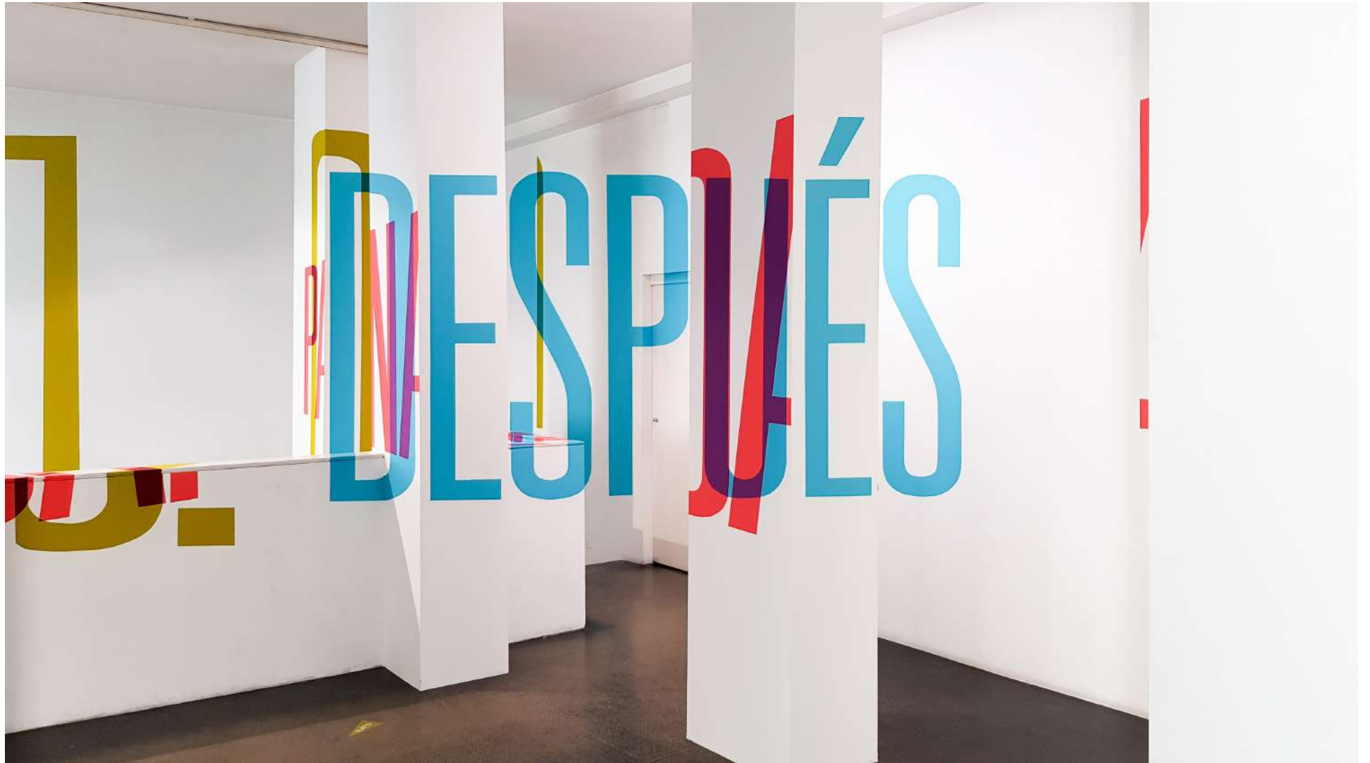
Vista general de la Galería Ponce + Robles. Exposición Vida . Boa Mistura Overview from Gallery Ponce + Robles. Exhibition Vida . Boa Mistura