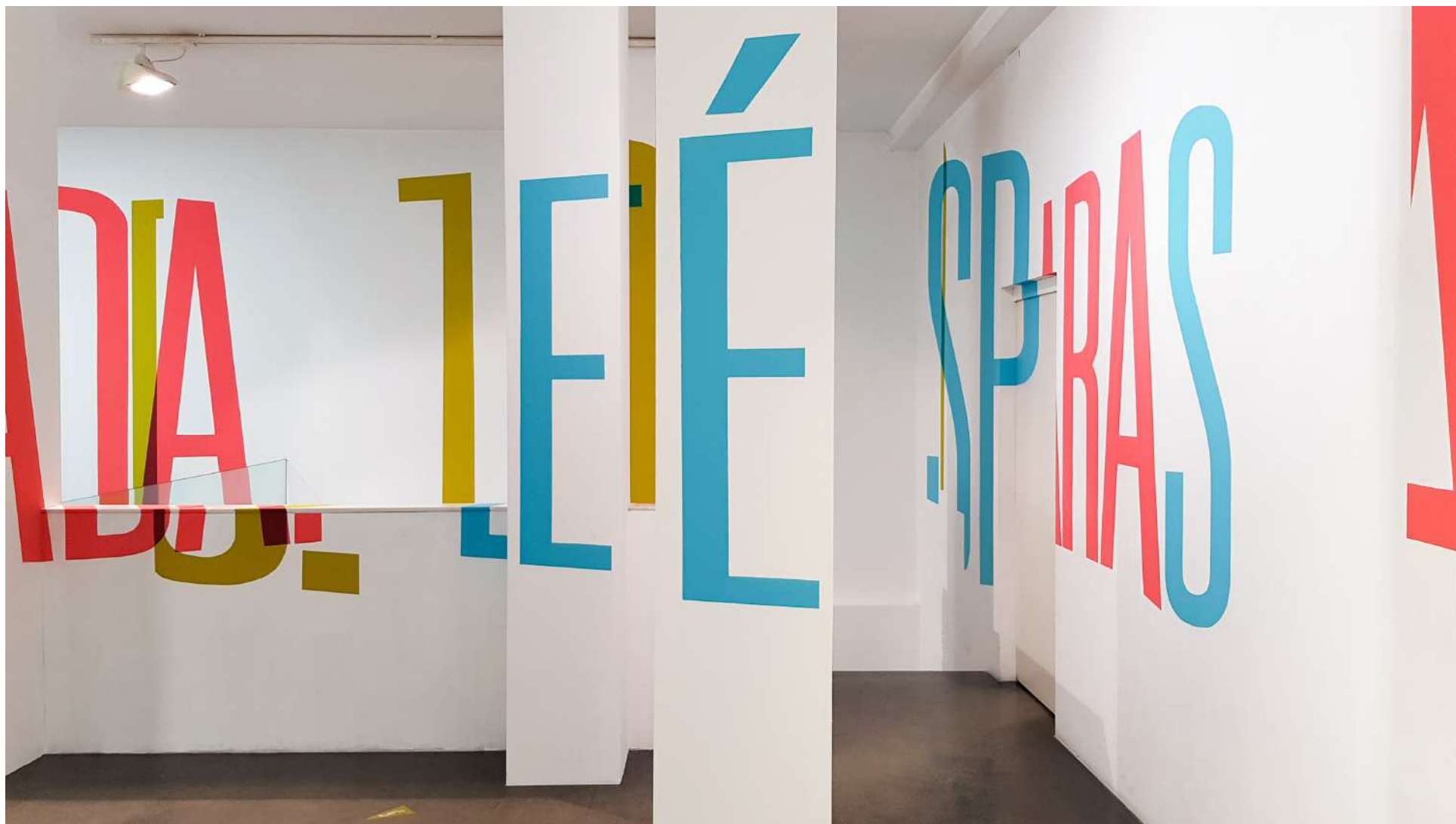
Vista general de la Galería Ponce + Robles. Exposición Vida . Boa Mistura Overview from Gallery Ponce + Robles. Exhibition Vida . Boa Mistura