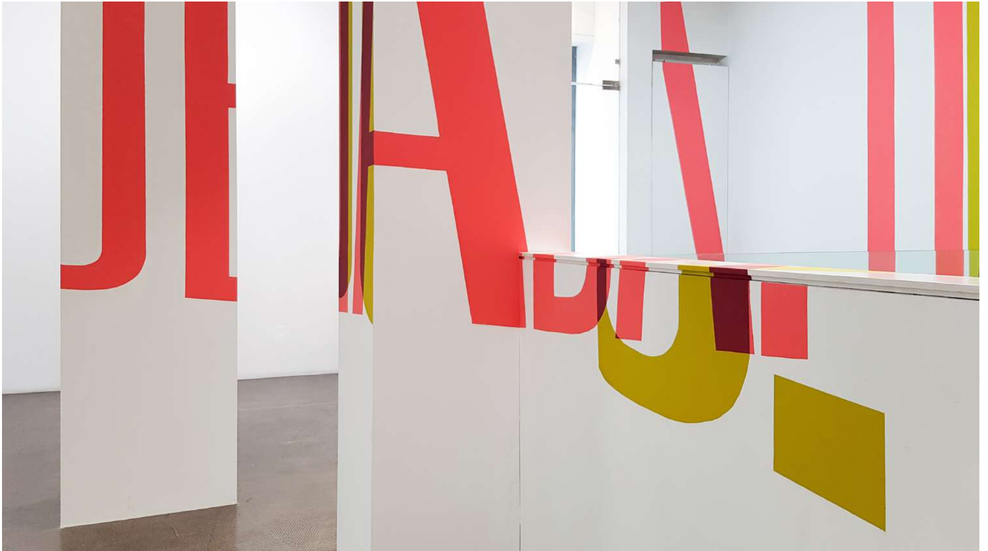
Vista general de la Galería Ponce + Robles. Exposición Vida . Boa Mistura Overview from Gallery Ponce + Robles. Exhibition Vida . Boa Mistura