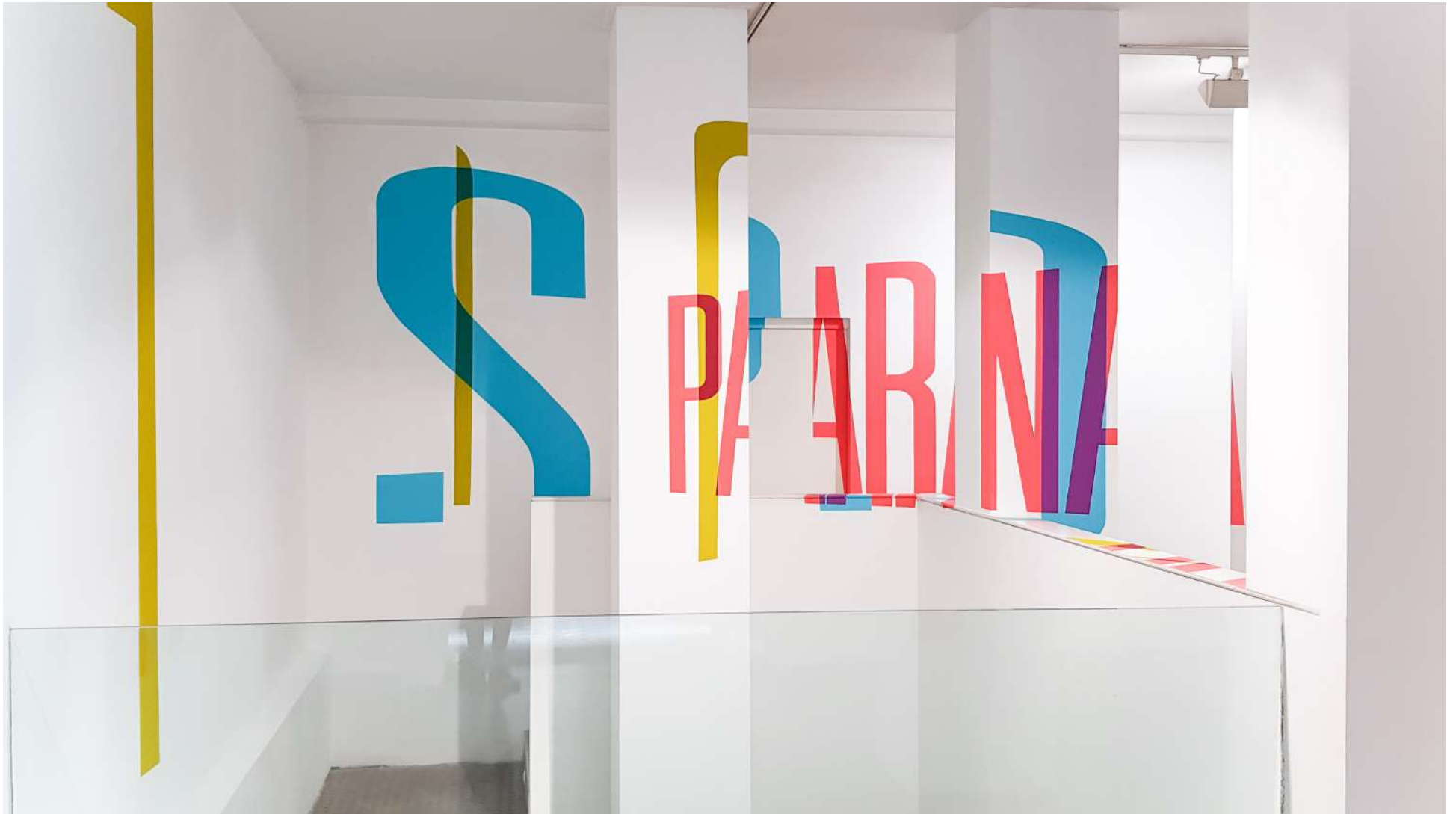
Vista general de la Galería Ponce + Robles. Exposición Vida . Boa Mistura Overview from Gallery Ponce + Robles. Exhibition Vida . Boa Mistura