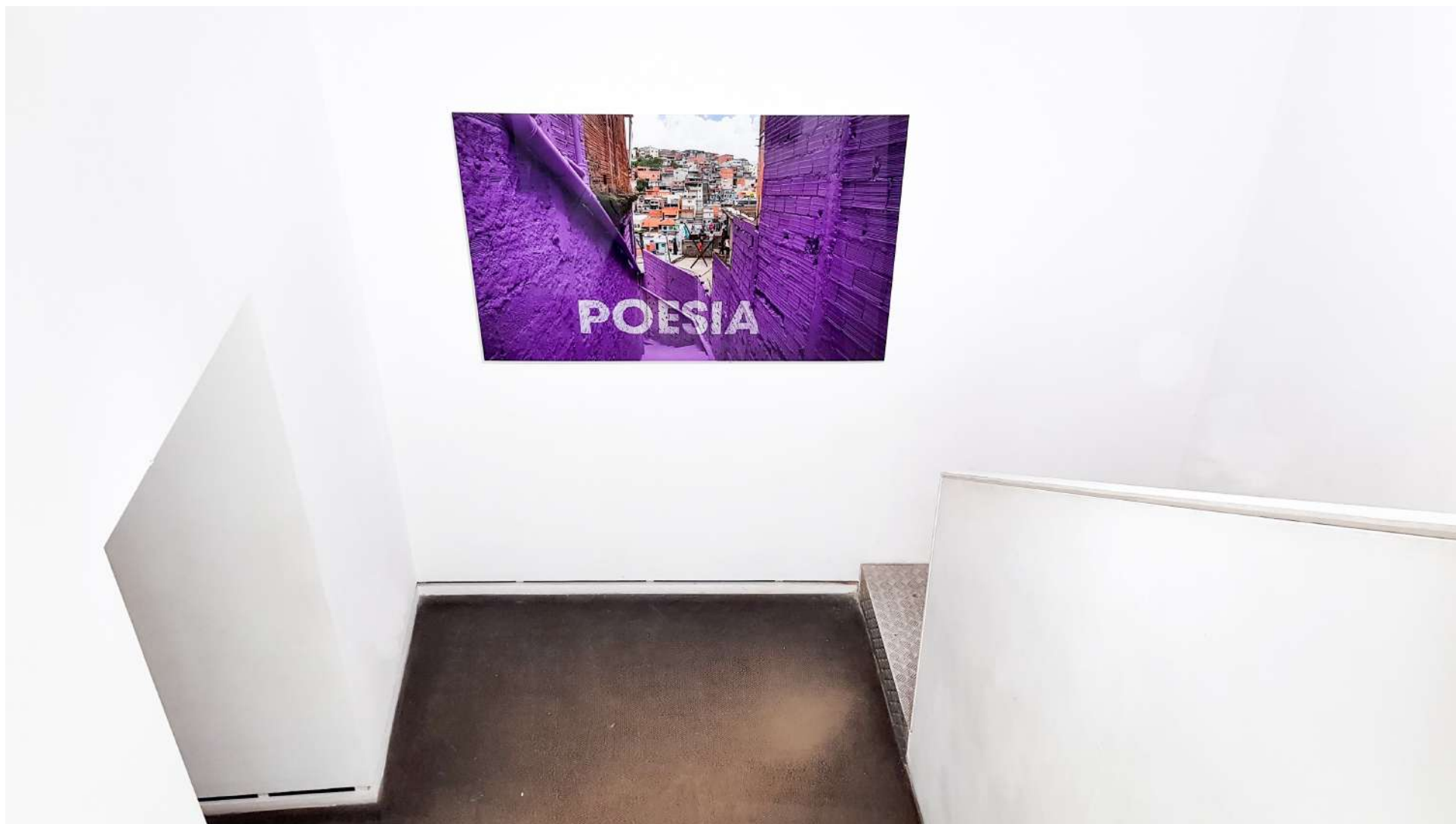
Vista general de la Galería Ponce + Robles. Exposición Vida . Boa Mistura Overview from Gallery Ponce + Robles. Exhibition Vida . Boa Mistura