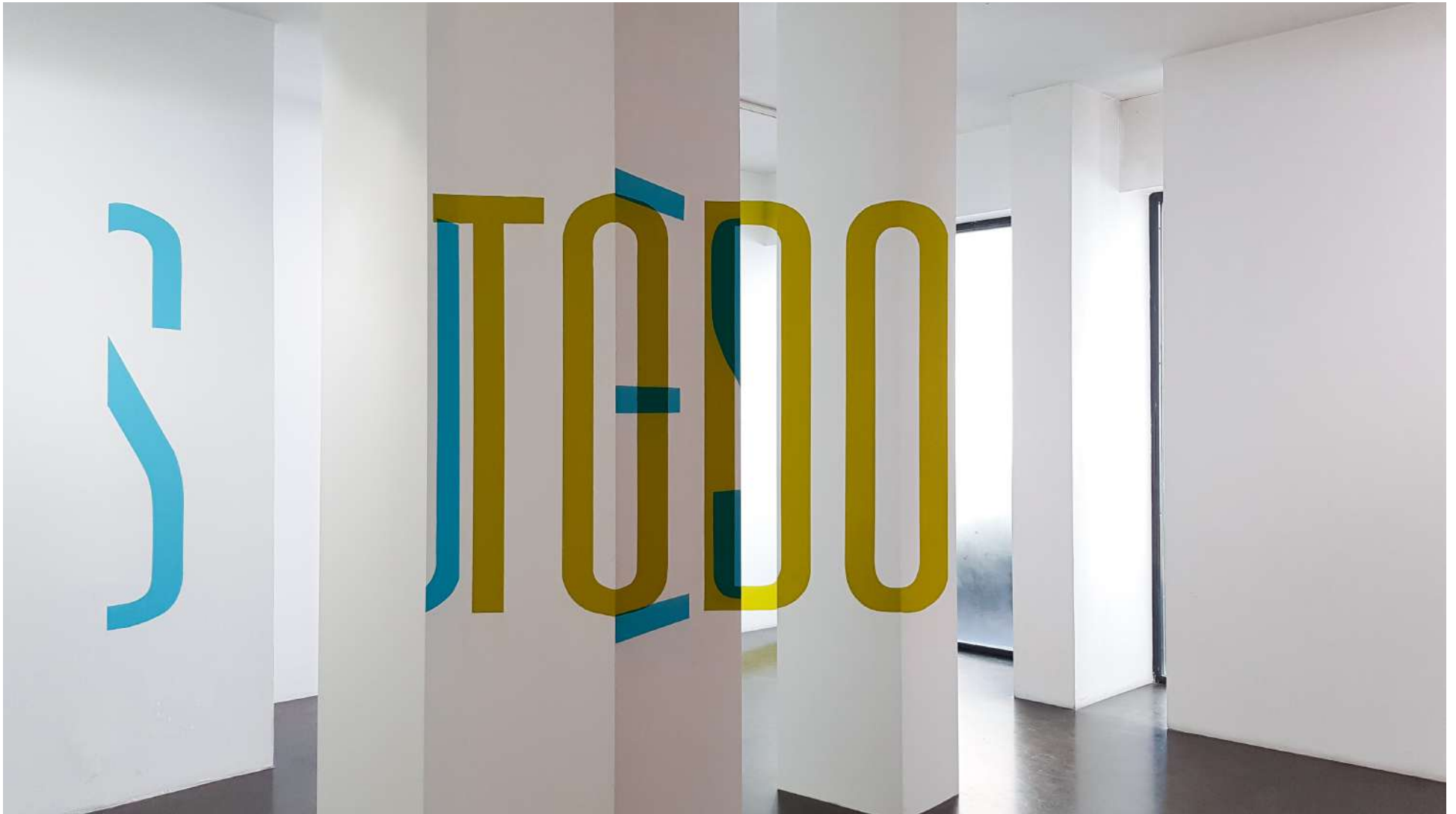
Vista general de la Galería Ponce + Robles. Exposición Vida . Boa Mistura Overview from Gallery Ponce + Robles. Exhibition Vida . Boa Mistura