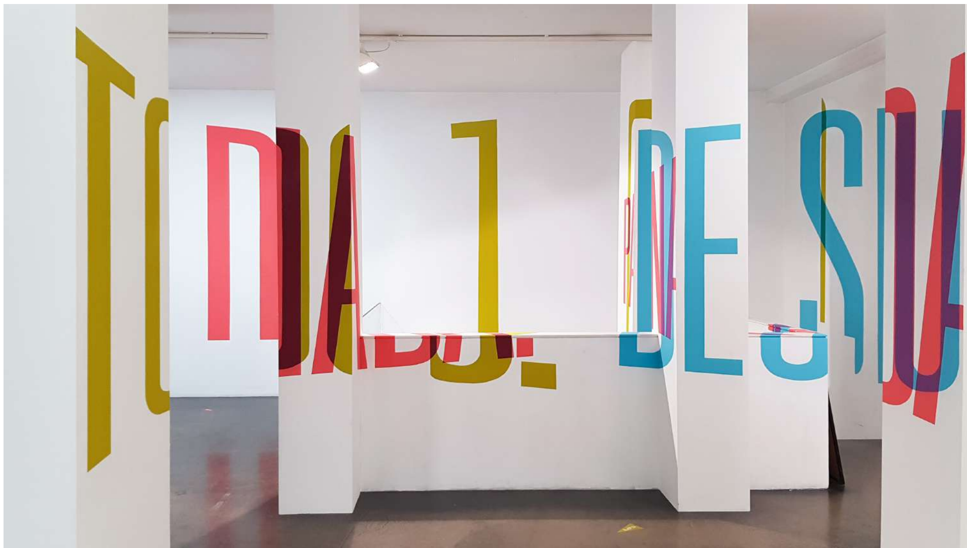
Vista general de la Galería Ponce + Robles. Exposición Vida . Boa Mistura Overview from Gallery Ponce + Robles. Exhibition Vida . Boa Mistura