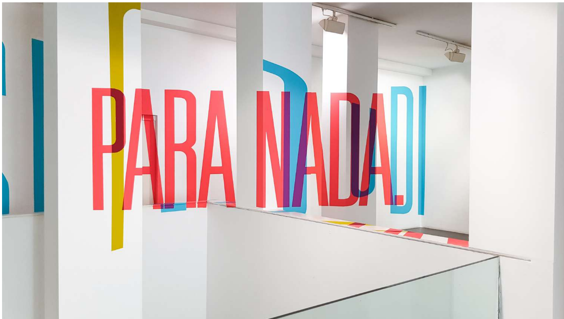
Vista general de la Galería Ponce + Robles. Exposición Vida . Boa Mistura Overview from Gallery Ponce + Robles. Exhibition Vida . Boa Mistura