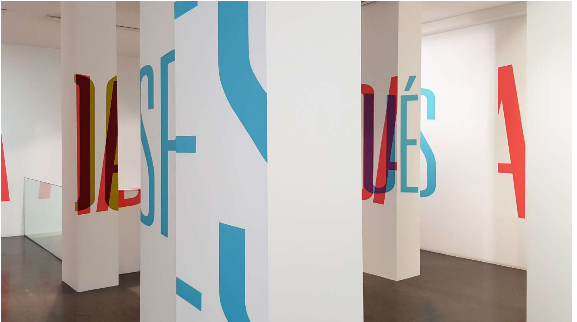
Vista general de la Galería Ponce + Robles. Exposición Vida . Boa Mistura Overview from Gallery Ponce + Robles. Exhibition Vida . Boa Mistura