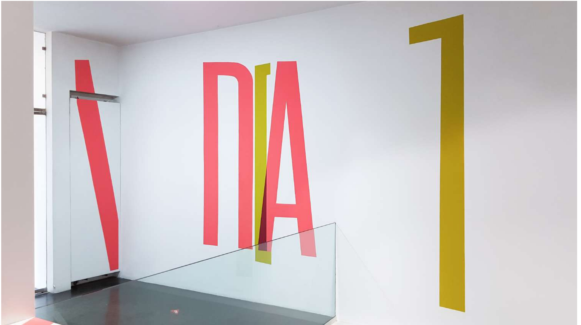
Vista general de la Galería Ponce + Robles. Exposición Vida . Boa Mistura Overview from Gallery Ponce + Robles. Exhibition Vida . Boa Mistura