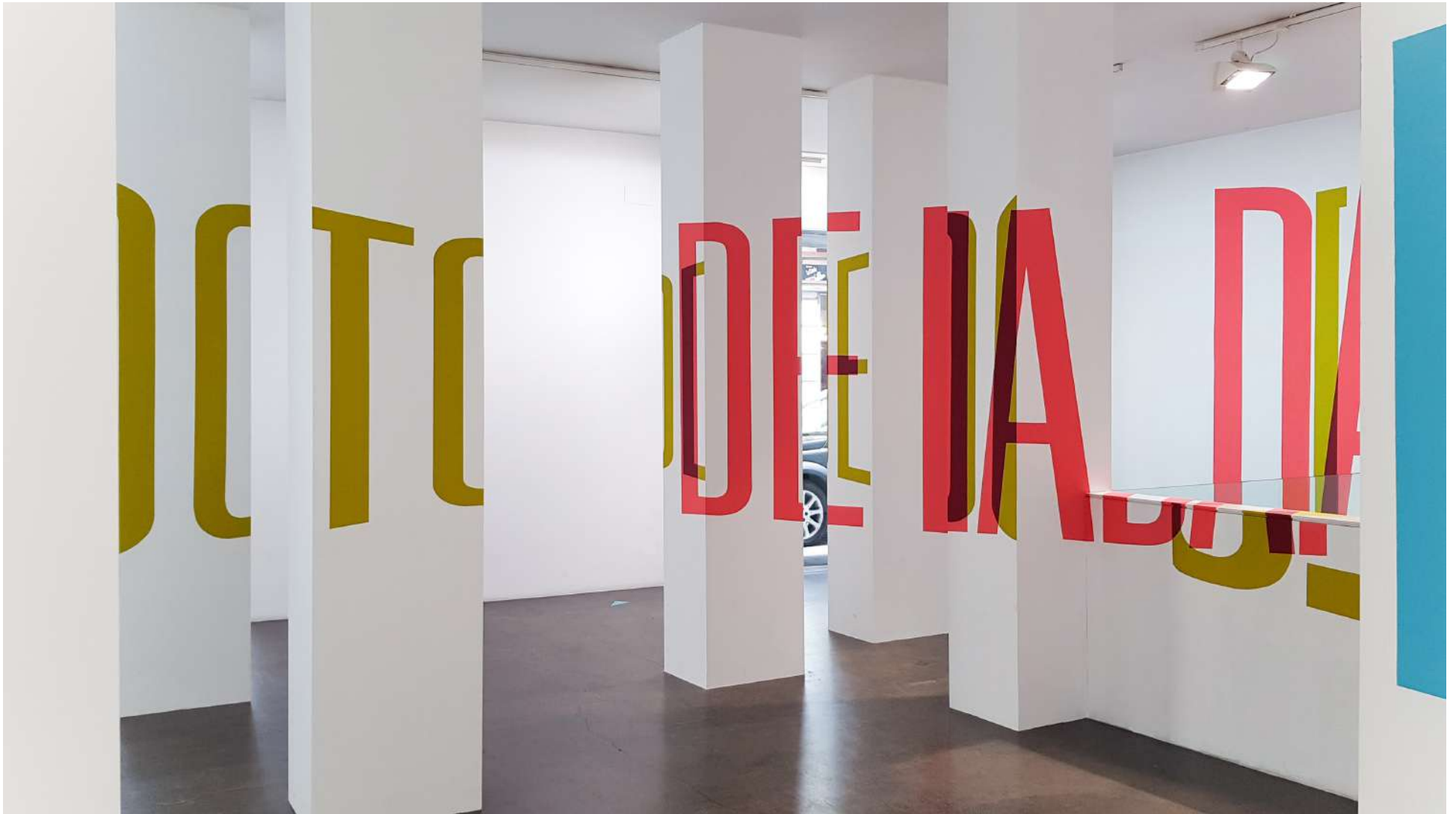
Vista general de la Galería Ponce + Robles. Exposición Vida . Boa Mistura Overview from Gallery Ponce + Robles. Exhibition Vida . Boa Mistura