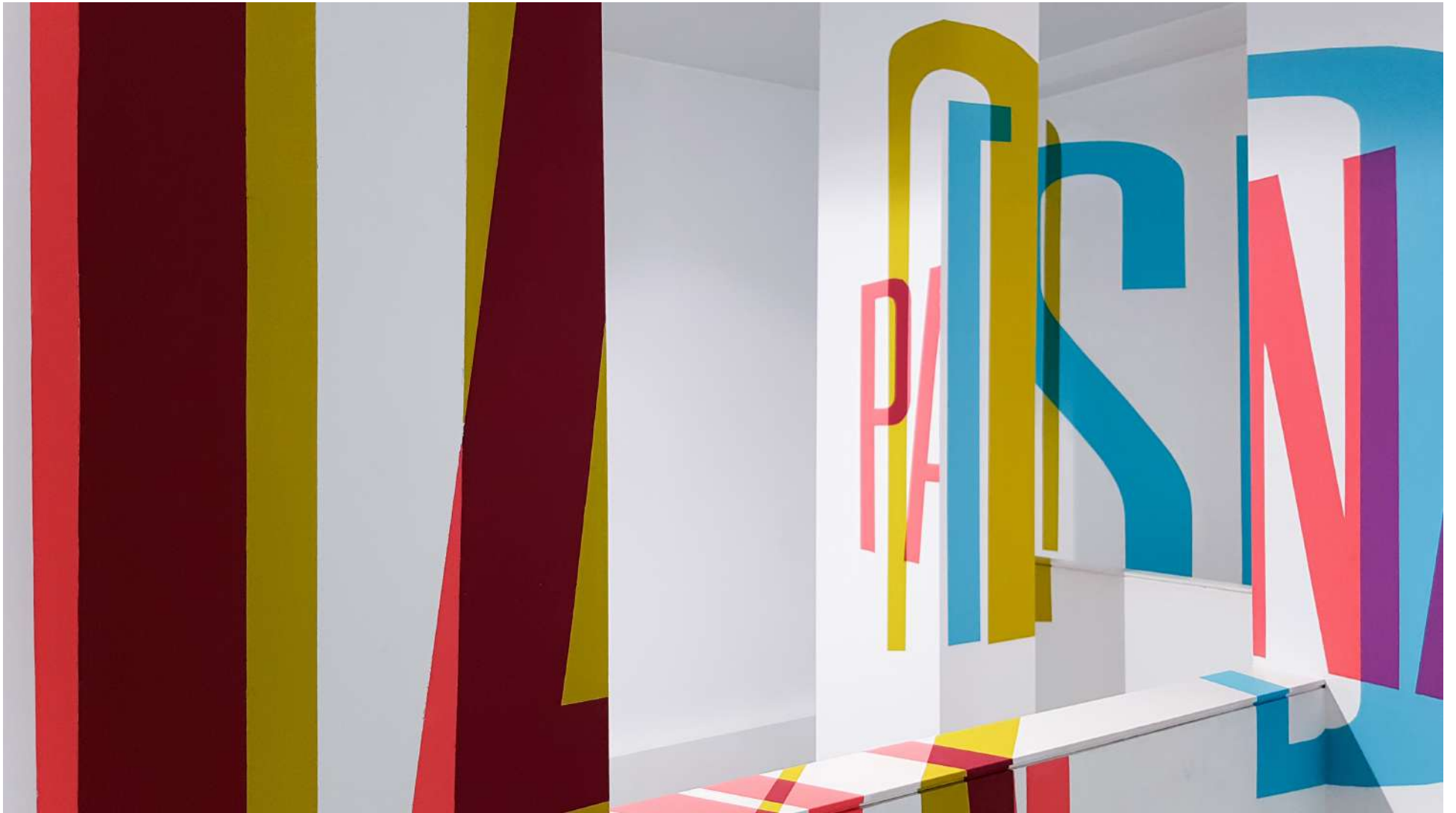
Vista general de la Galería Ponce + Robles. Exposición Vida . Boa Mistura Overview from Gallery Ponce + Robles. Exhibition Vida . Boa Mistura