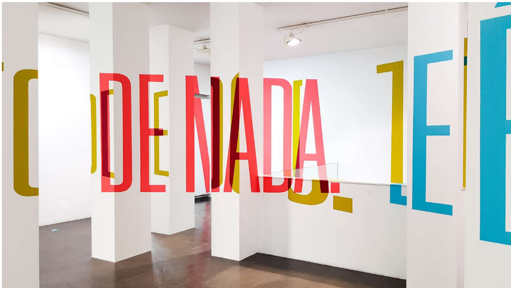
Vista general de la Galería Ponce + Robles. Exposición Vida . Boa Mistura Overview from Gallery Ponce + Robles. Exhibition Vida . Boa Mistura