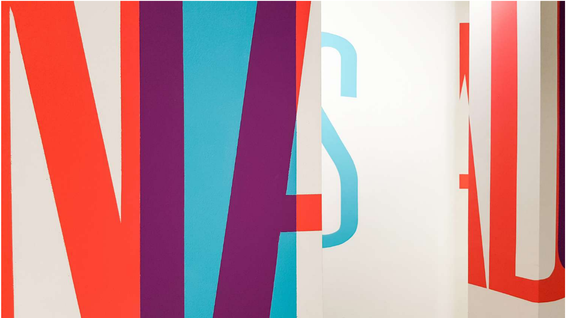
Vista general de la Galería Ponce + Robles. Exposición Vida . Boa Mistura Overview from Gallery Ponce + Robles. Exhibition Vida . Boa Mistura