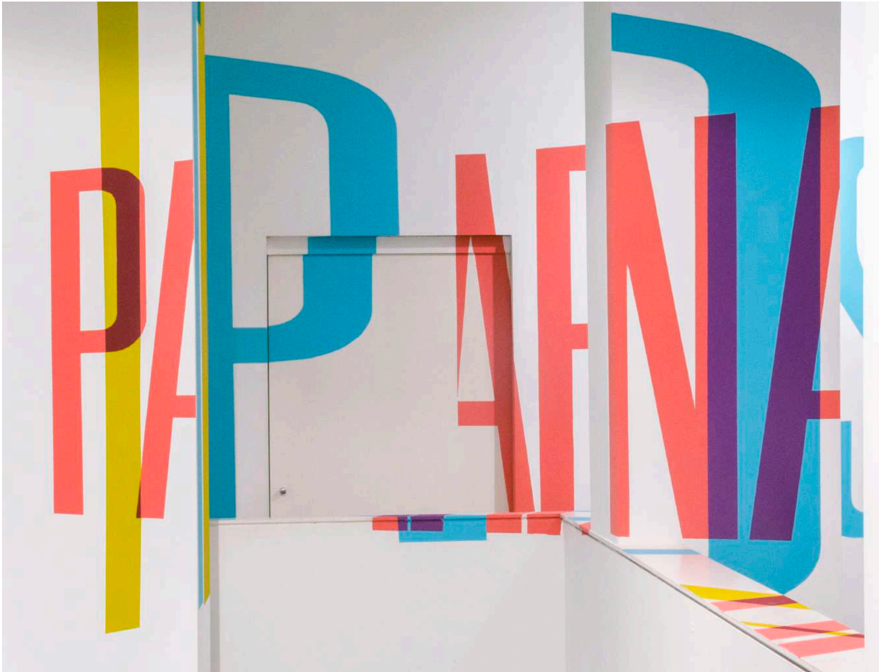
Vista general de la Galería Ponce + Robles. Exposición Vida . Boa Mistura (fotografía realizada por Boa Mistura) Overview from Gallery Ponce + Robles. Exhibition Vida . Boa Mistura (photography by Boa Mistura)