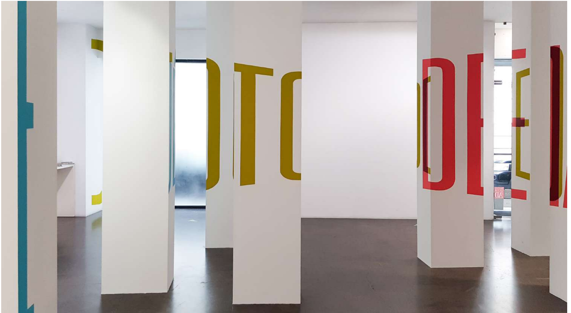
Vista general de la Galería Ponce + Robles. Exposición Vida . Boa Mistura Overview from Gallery Ponce + Robles. Exhibition Vida . Boa Mistura