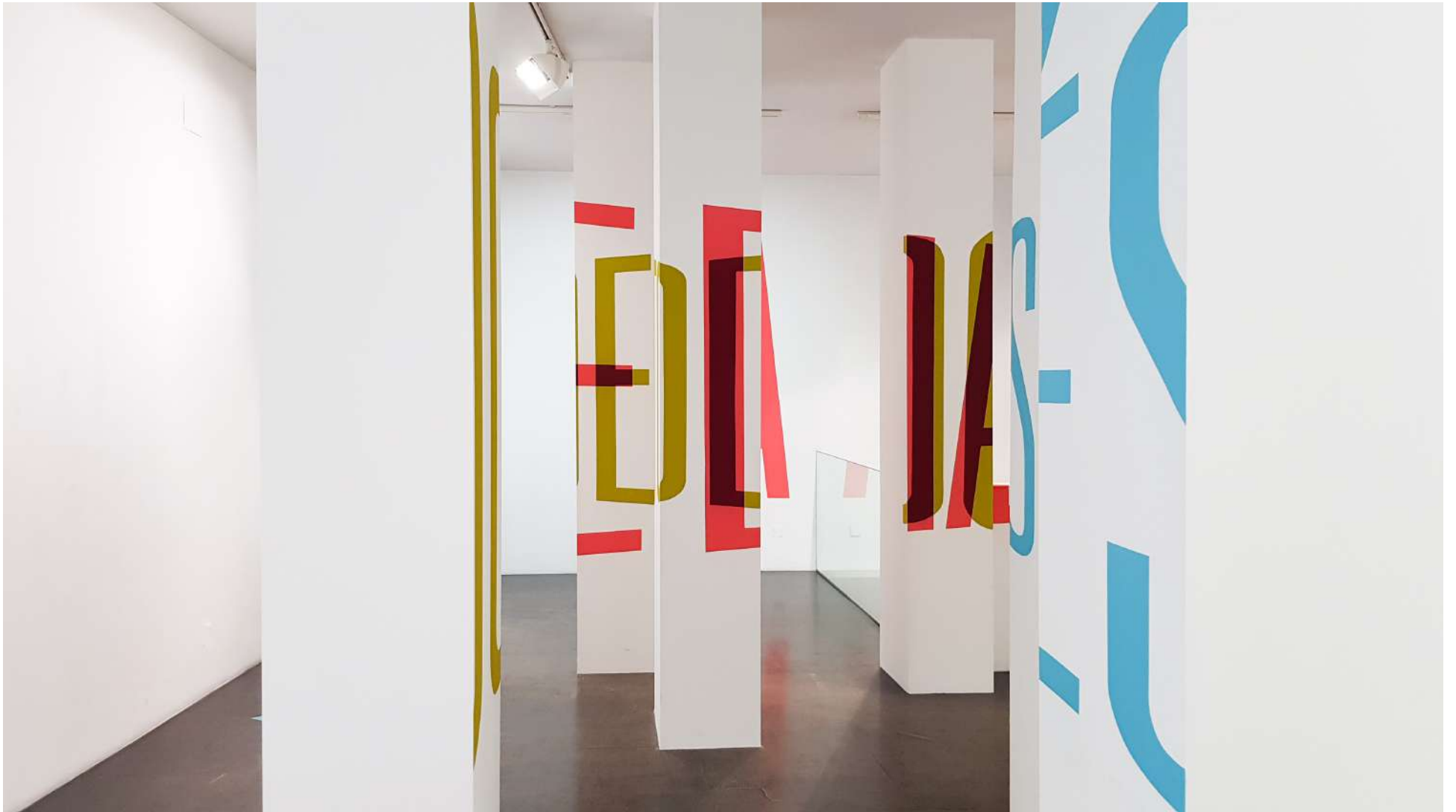
Vista general de la Galería Ponce + Robles. Exposición Vida . Boa Mistura Overview from Gallery Ponce + Robles. Exhibition Vida . Boa Mistura