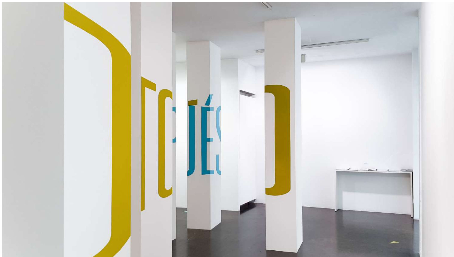
Vista general de la Galería Ponce + Robles. Exposición Vida . Boa Mistura Overview from Gallery Ponce + Robles. Exhibition Vida . Boa Mistura