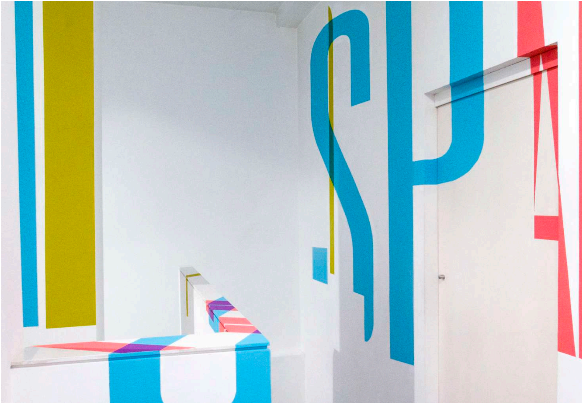
Vista general de la Galería Ponce + Robles. Exposición Vida . Boa Mistura Overview from Gallery Ponce + Robles. Exhibition Vida . Boa Mistura