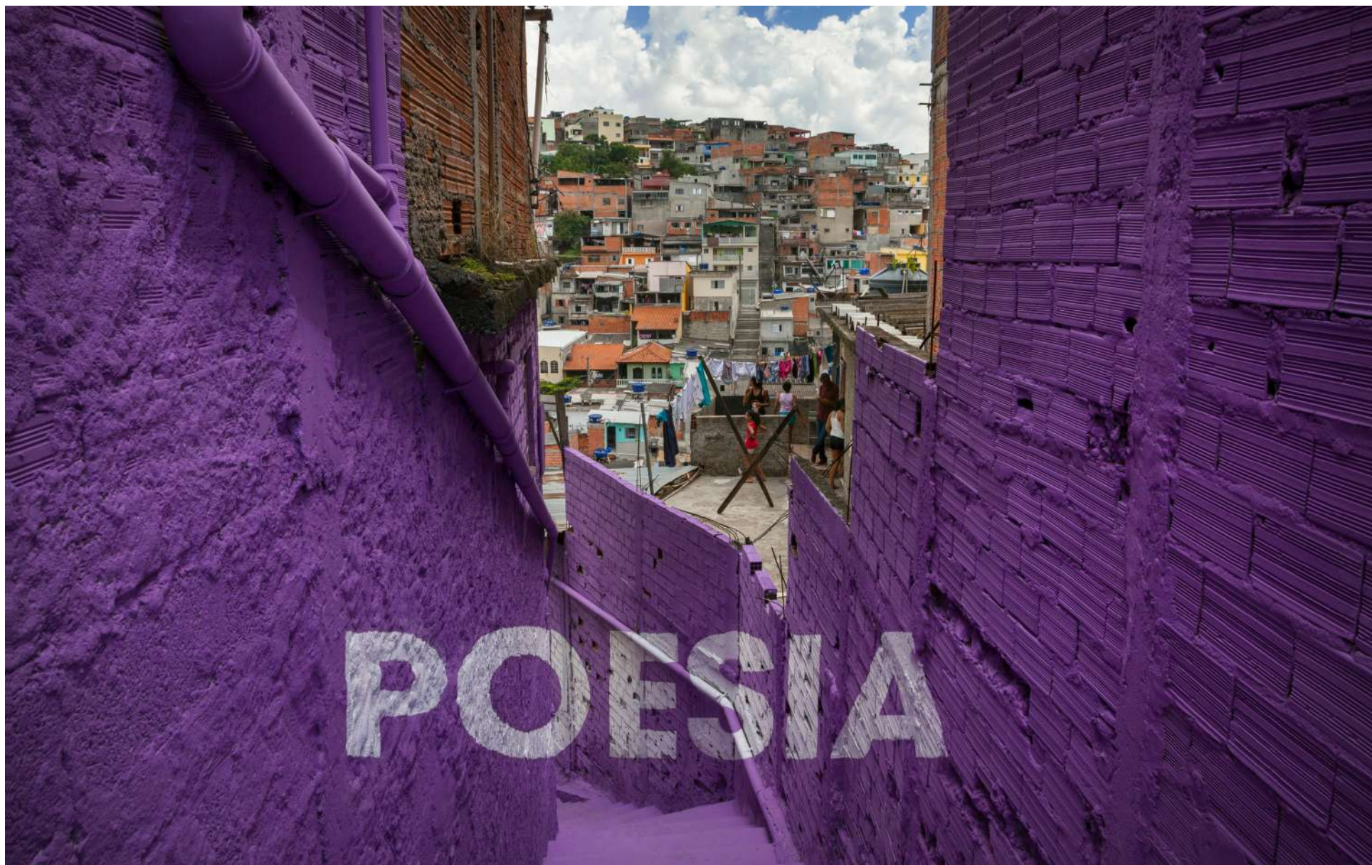
Detalle de Poesía, 2012 Boa Mistura. Impresión digital sobre RC siliconado en metacrilato de 5mm. Ed. 5+2PA Detail: Poesía 2012 Boa Mistura. Digital impression on silicone RC in 5mm methacrylate. Ed. 5+2AP