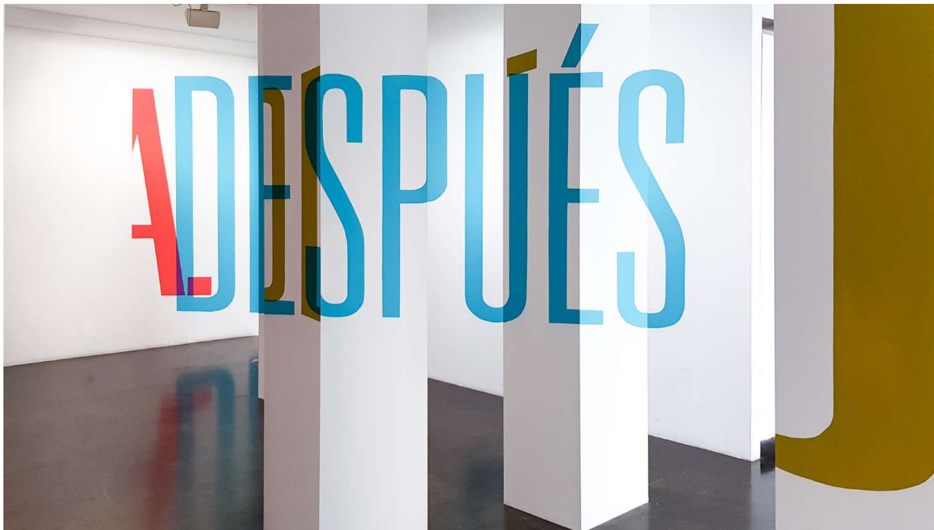
Vista general de la Galería Ponce + Robles. Exposición Vida . Boa Mistura Overview from Gallery Ponce + Robles. Exhibition Vida . Boa Mistura