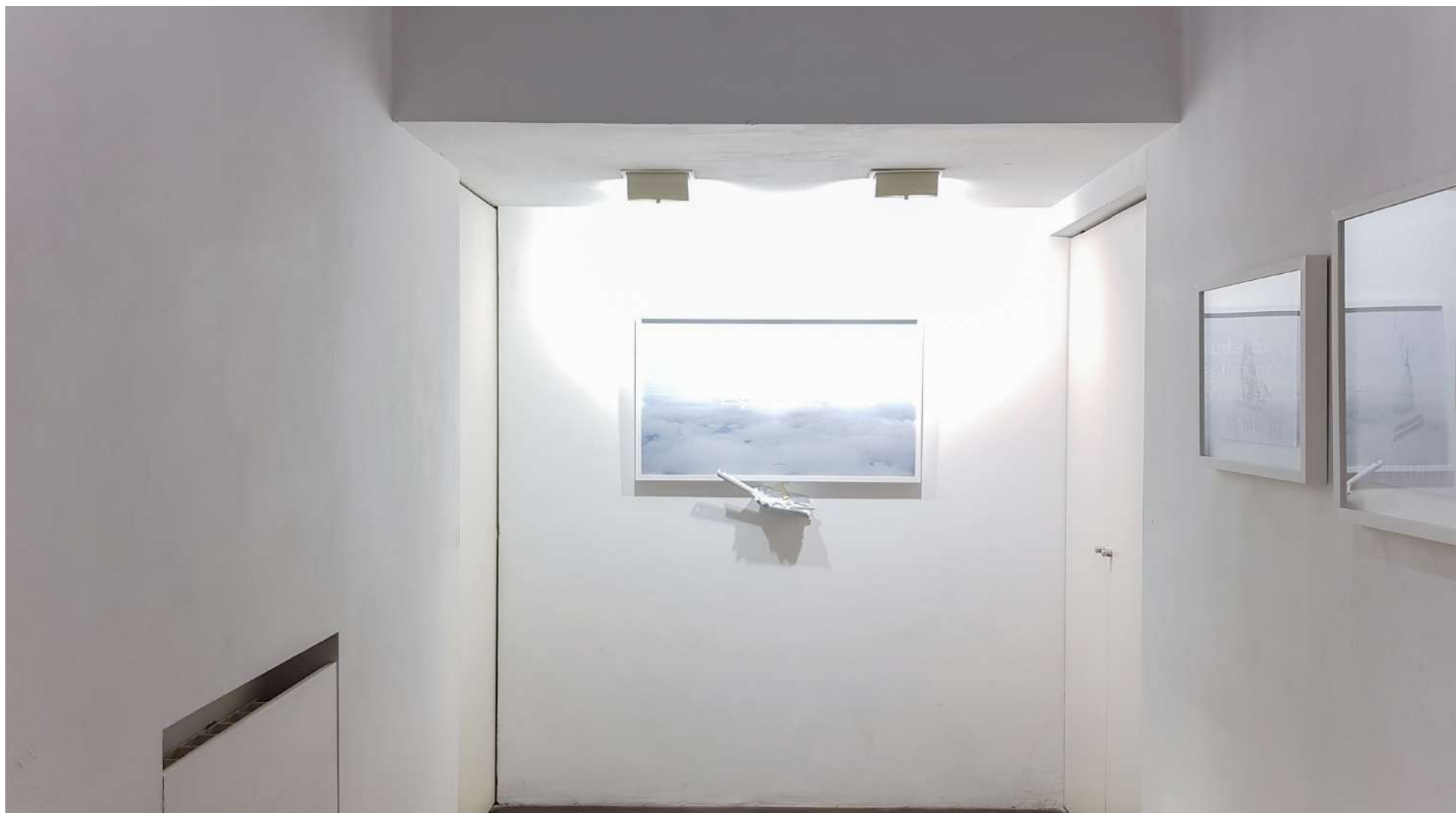
Vista general de la Galería Ponce + Robles. Exposición Construcción de futuros . Ricardo Calero Overview from Gallery Ponce + Robles. Exhibition Construcción de futuros (Shaping Futures) . Ricardo Calero