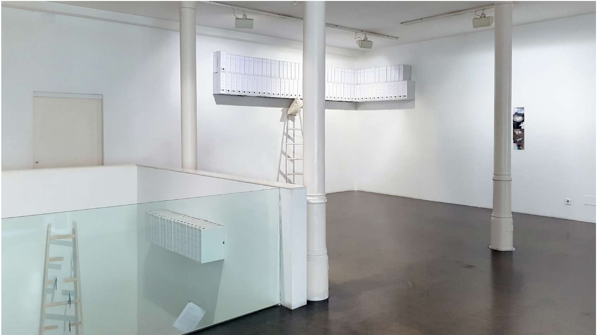
Vista general de la Galería Ponce + Robles. Exposición Construcción de futuros . Ricardo Calero Overview from Gallery Ponce + Robles. Exhibition Construcción de futuros (Shaping Futures) . Ricardo Calero