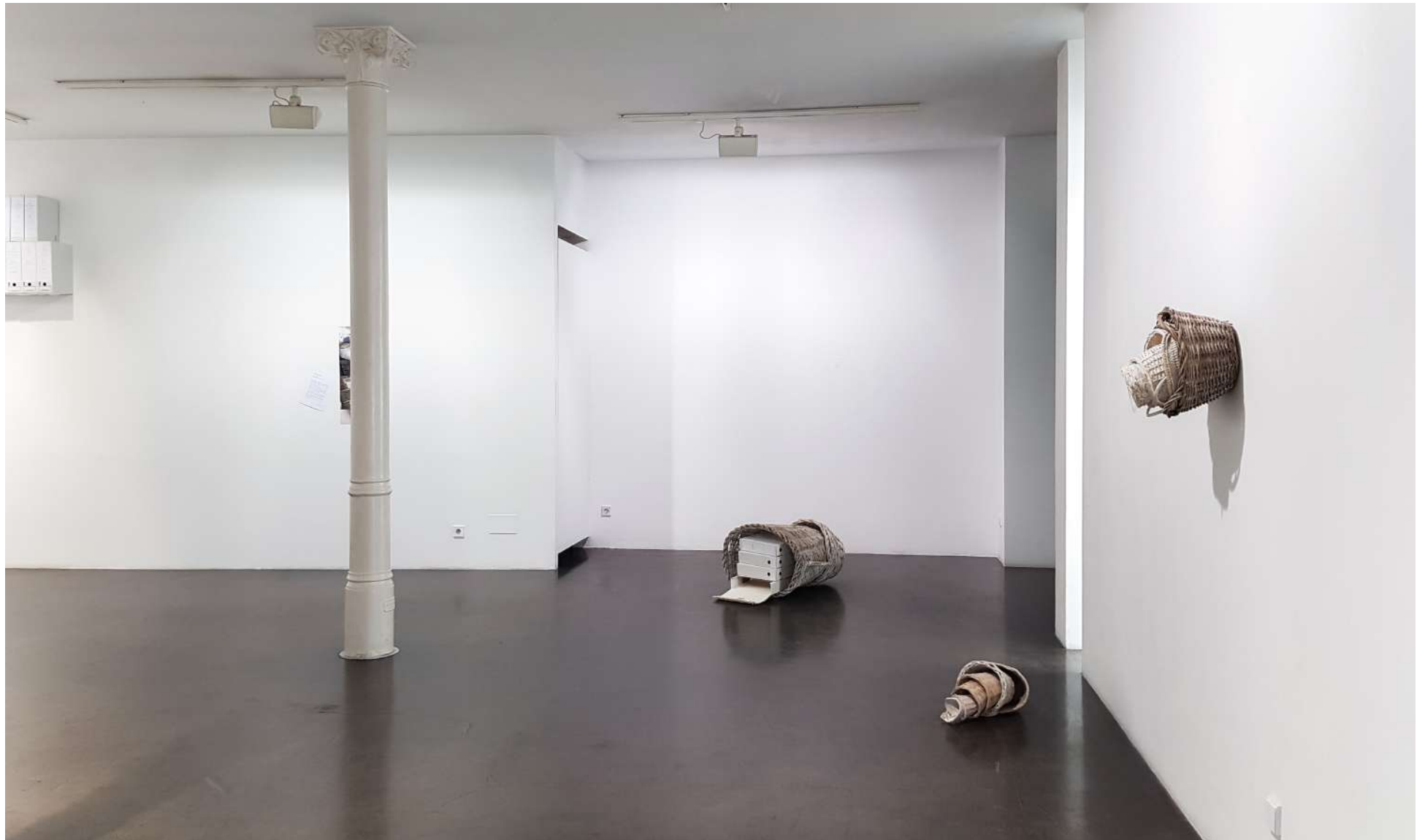
Vista general de la Galería Ponce + Robles. Exposición Construcción de futuros . Ricardo Calero Overview from Gallery Ponce + Robles. Exhibition Construcción de futuros (Shaping Futures) . Ricardo Calero