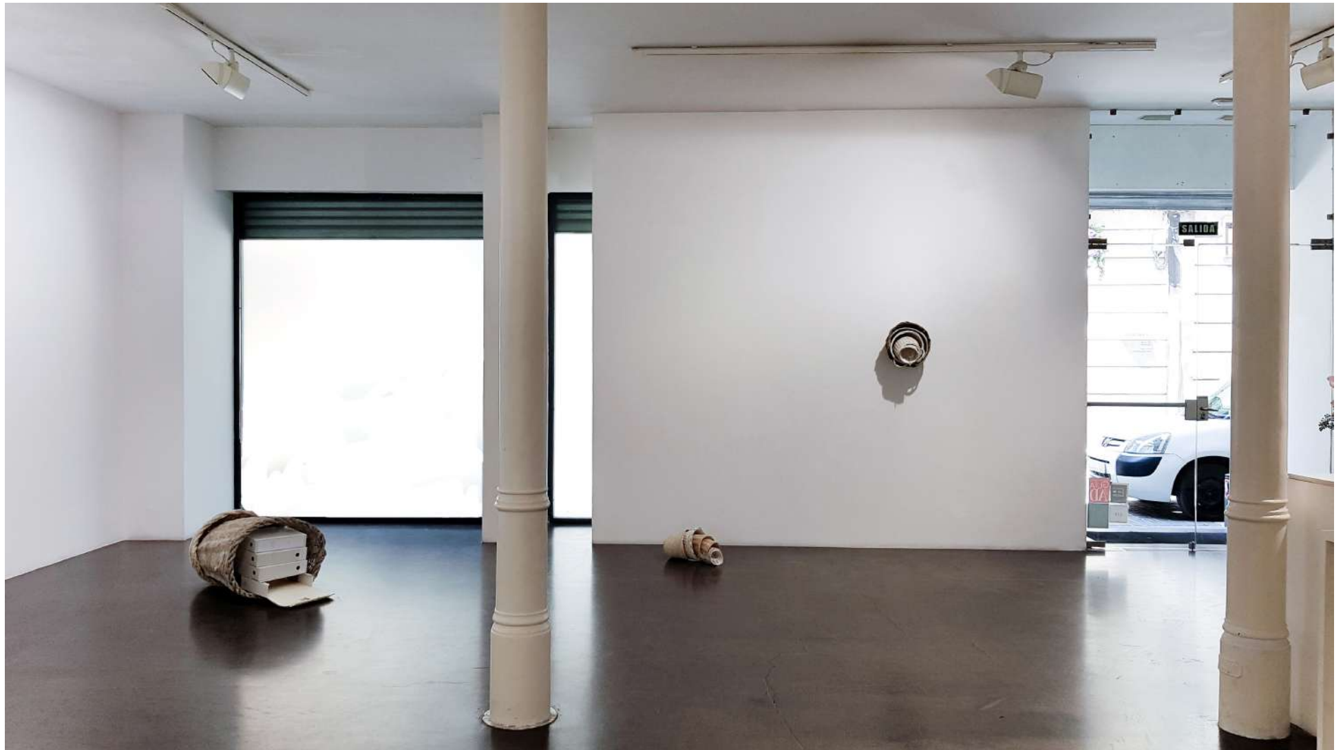
Vista general de la Galería Ponce + Robles. Exposición Construcción de futuros . Ricardo Calero Overview from Gallery Ponce + Robles. Exhibition Construcción de futuros (Shaping Futures) . Ricardo Calero