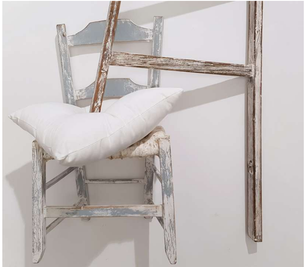
Detalle de la instalación Ricardo Calero, Sueño y deseo , 2018. Serie Cuidar el pensar