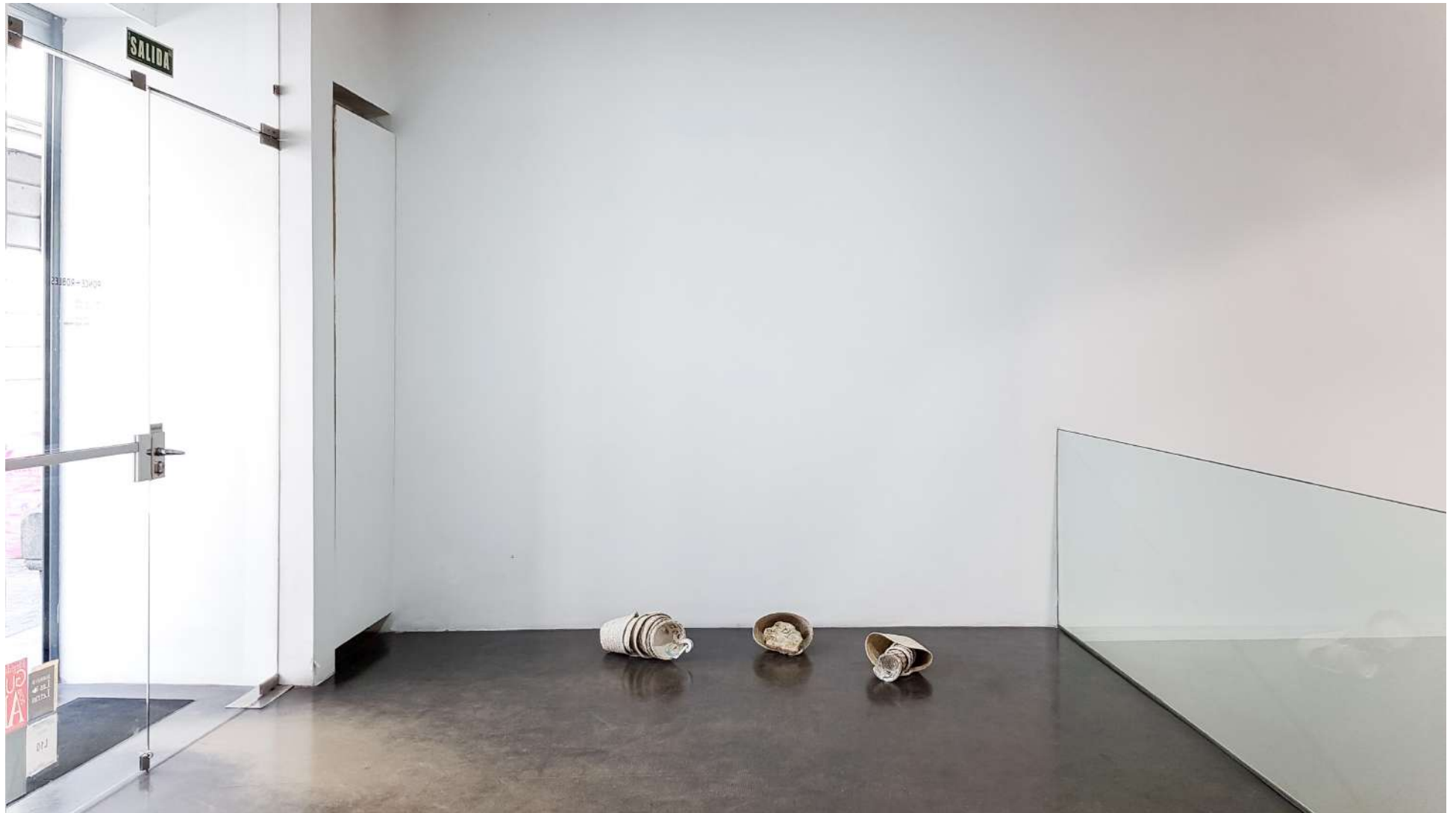
Vista general de la Galería Ponce + Robles. Exposición Construcción de futuros . Ricardo Calero Overview from Gallery Ponce + Robles. Exhibition Construcción de futuros (Shaping Futures) . Ricardo Calero